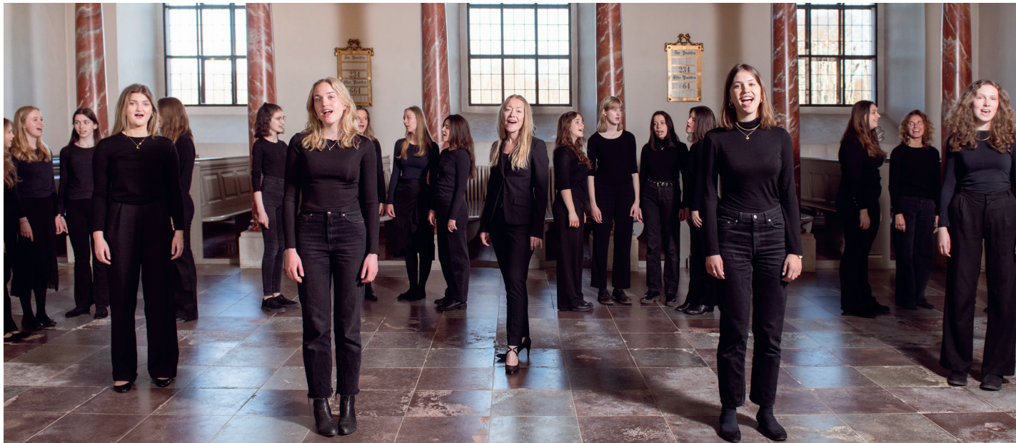
Fredensborg Slotskirkes Pigekor synger julen ind torsdag 8. december.