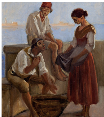
Wilhelm Marstrand, En ung pige og to fiskere , ca. 1853. Nivaagaards Malerisamling.