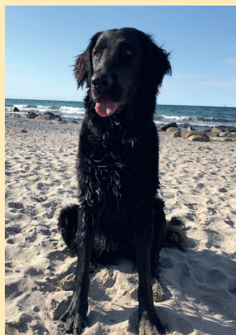
Mod hunden Nellie til hundecroquis!

Gratis deltagelse, når entréen er betalt. Der er begrænset antal pladser. Tilmelding via info@nivaagaard.dk