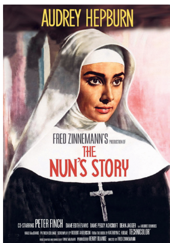
Nonnen. Warner Bros.