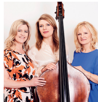
Blonde Bass fylder museet med musik 27. oktober.

Caféen serverer inden koncerten aftenens ret til 160 kr. Køb billet på nivaagaard.dk