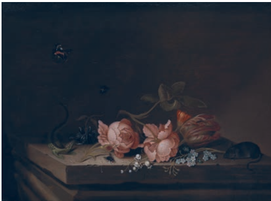
Jan Baptist van Fornenburgh, Blomster , u.å. Deponering fra Statens Museum for Kunst