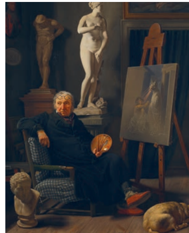
Martinus Rørbye, Portræt af maleren C.A. Lorentzen , 1827. Nivaagaards Malerisamling