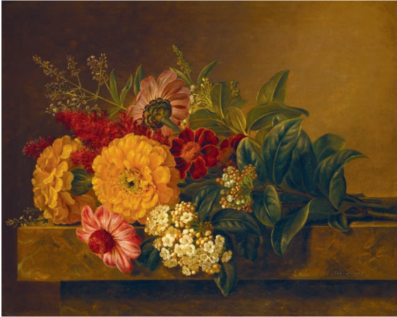
J.L. Jensen, Nature morte med blomster på en marmorbordplade , 1833 Thorvaldsens Museum