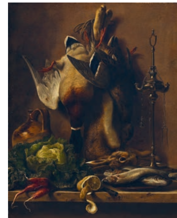
J.L. Jensen, Nature morte med grøntsager og vildt på et køkkenbord , 1835. Thorvaldsens Museum

Urter og planter males omhyggeligt i guldalderens stillebentradition. Vi begynder aftenen med en absintsmagning præpareret af cafeens egen restauratør Richard Roth. Derefter en omvisning i udstillingerne med motiver af planter, blomster og livet i 1800-tallet. Tilbage i museets cafe samles indtrykkene ved en to-retters menu tilberedt med udgangspunkt i urter og malerier. Tilmelding nødvendig. Begrænset antal pladser. Absintsmagning, omvisning og middag (ekskl. drikkevarer) 300 kr. 10 % rabat til årskortholdere