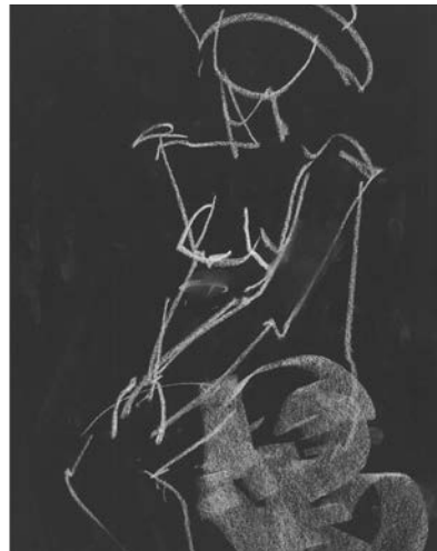
Croquis hver onsdag