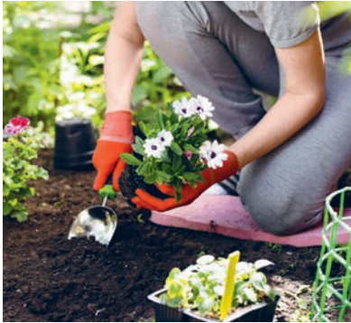
Foredrag om den helende natur

ONSDAG 24. JANUAR KL 14.45-16.45 OG KL 17-19