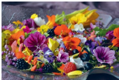
Foredrag med Aiah Noack om spiselige blomster