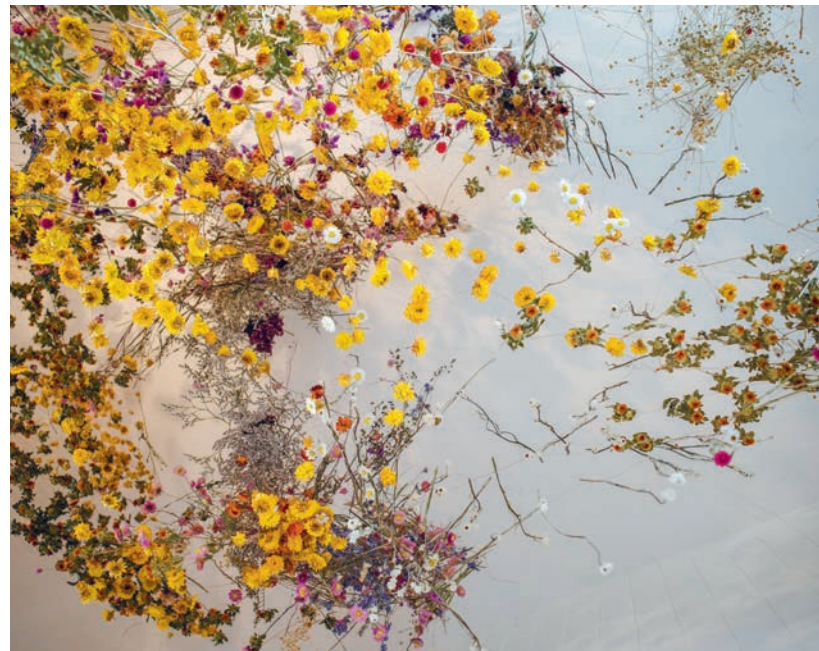
Rebecca Louise Law, Yellow , 2016

TORS DAG 22. FEBRUAR KL 17 FORFATTERAFTEN HANNE-VIBEKE HOLST