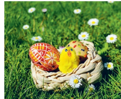
Påskearrangement for børnefamilier søndag 18. marts

åbner museet med sang og fællessang. Gratis for årskortholdere eller når entreen er betalt