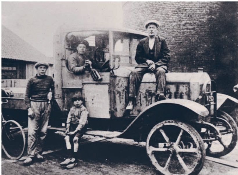
Særomvisning i fotoudstillingen fra Nivaagaards storhedstid og det gamle Nivå