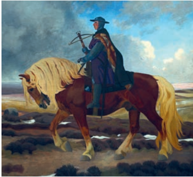
Agnes Slott-Møller, Niels Ebbesen 1893-1894, Randers Kunstmuseum