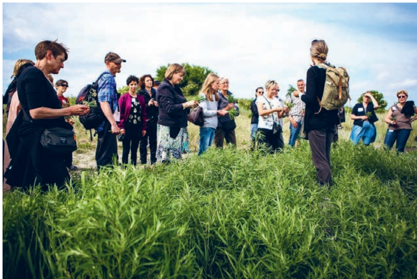
Museet genoptager de populære sanketure til Nivå Strandenge. Kom med den 30. april eller 21. maj.