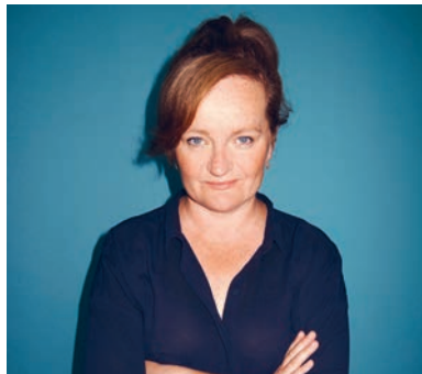
Forfatterforedrag med Dorthe Nors 31. januar.