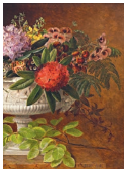
Et af Malerisamlingens seneste indkøbte værker: J.L. Jensen, Blomster i en opsats på marmorkarm med bøgegren , 1846 (udsnit)

Støttebeløbet er fradragsberettiget. Støt via vores hjemmeside eller ved henvendelse i museumsreceptionen.