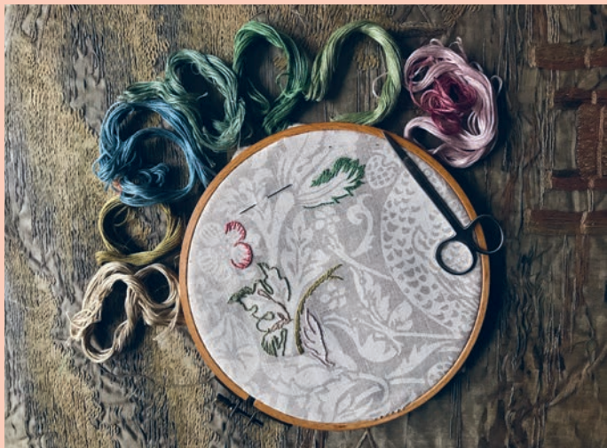
Pudecover-broderikit over Morris-mønstret Strawberry Thief