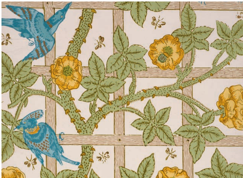
Hver søndag er der gratis introduktion til særudstillingen. Her ses William Morris, Trellis (Espalier), 1862 (udsnit)