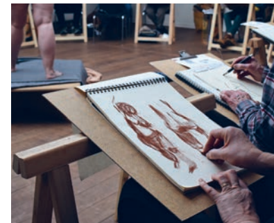
Croquistegning med underviser og model hver onsdag på museet.

I anledning af Morris-udstillingen giver cafeen over fire søndage vores museumsgæster mulighed for at opleve en ægte britisk søndagsklassiker, Sunday Roast: helstegt oksesteg med Yorkshire-pudding, gravy, roast potatoes, cauliflower cheese & carrots. Reservation nødvendig. Pris 165 kr. 10% rabat for årskortholdere. (Se s. 37)