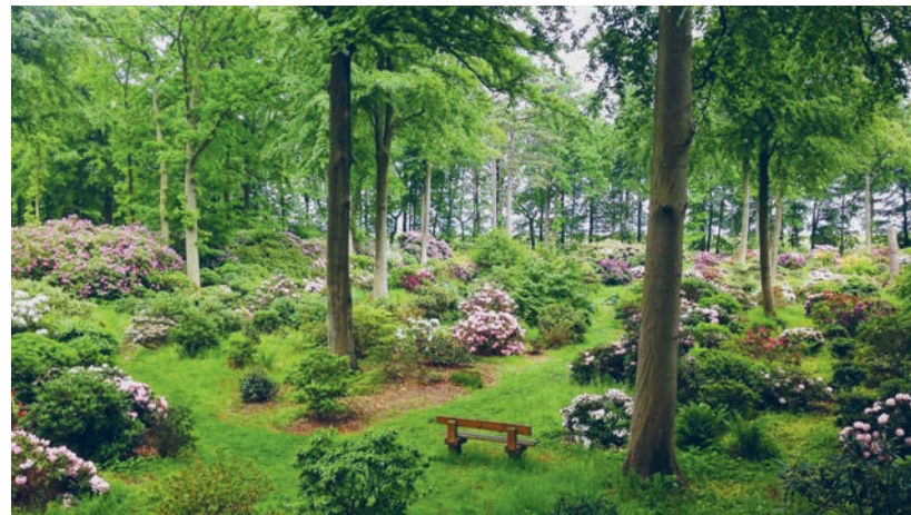
Museets rodondendronpark blomstrer i maj-juni.

Gratis for årskortholdere eller når entreen er betalt.