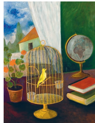
Storm P., Kanarieflugten i buret, 1930-32