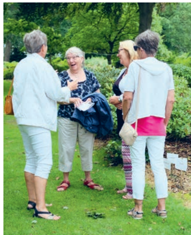
Ordvandring i Reservat for truede ord

Omvisningen er gratis for årskortholdere eller når entreen er betalt