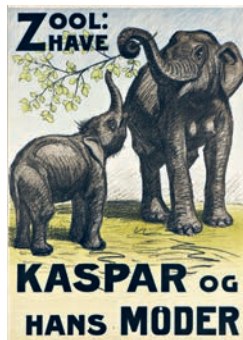
Sven Brasch, Gabende flodhest og Kaspar og hans moder udgivet 1924, Zoo-plakat © Sven Brasch/ copydanbilleder.dk