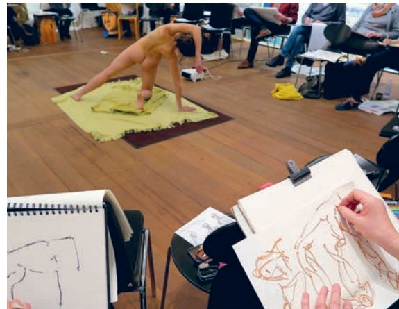
Croquisundervisning med eftermiddagshold og aftenhold

Omvisningen er gratis for årskortholdere og børn (u. 18) eller når entreen er betalt.