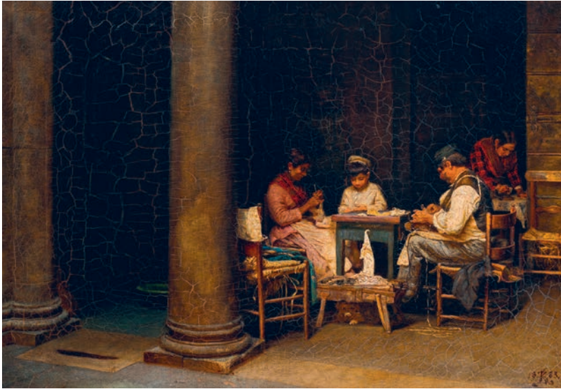
Kristian Zahrtmann, Palazetto Farneses gård , 1883. Nivaagaards Malerisamling

SØNDAG DEN 30. APRIL KL 12 KUNSTHISTORIER