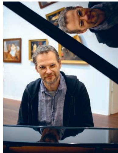
Nikolaj Hess-koncerter på museet