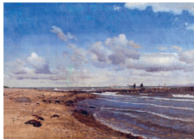
P.C. Skovgaard, Stranden ved Hellebæk , 1858 Nivaagaards Malerisamling

Tegneundervisning for børn og unge Forudgående indmeldelse nødvendig