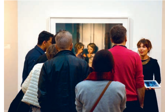
Kunsthistorier hver søndag kl 12 og 14