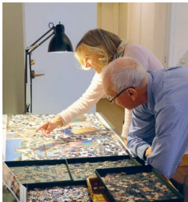
Puslespil i cafeen på udvalgte tirsdage

Omvisningen er gratis for årskort- holdere eller når entreen er betalt