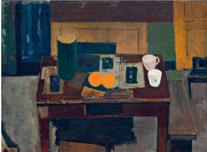
Immanuel Ibsen, Opstilling, bord med appelsiner , 1934 Deponering fra Louisiana Museum for Moderne Kunst