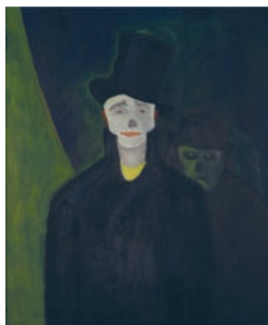
Storm P., Humsti Bumsti , 1945 ARoS Aarhus Kunstmuseum

Humsti Bumsti. Storm P. og malerierne fortsætter heldigvis til 12. marts! Udstillingen fokuserer på Storm P. som billedkunstner. Således kan man på Malerisamlingen se et meget stort antal af de ca. 160 værker han malede. Et rekordstort antal gæster har lagt vejen forbi for at opleve denne mere ukendte side af den folkekære kunstner.