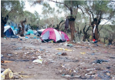
Filmstill fra én af fire film som vises fra marts i Verdens Mindste Kunstbiograf: Kunstnergruppen Other Story's film Ali , fra 2016