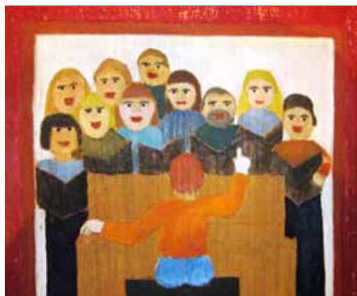
..... LENE BIDSTRUP Sangkor, 2004 Træsnit .....