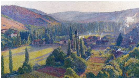
Henri Martin, Labastide-du-Vert, morgen , efter 1900 Musée de Cahors Henri-Martin