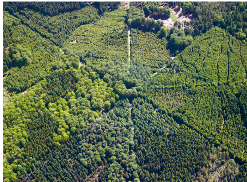
Dyrehavsstjerne mod syd

åbner museet med sang Gratis for årskortholdere eller når entreen er betalt