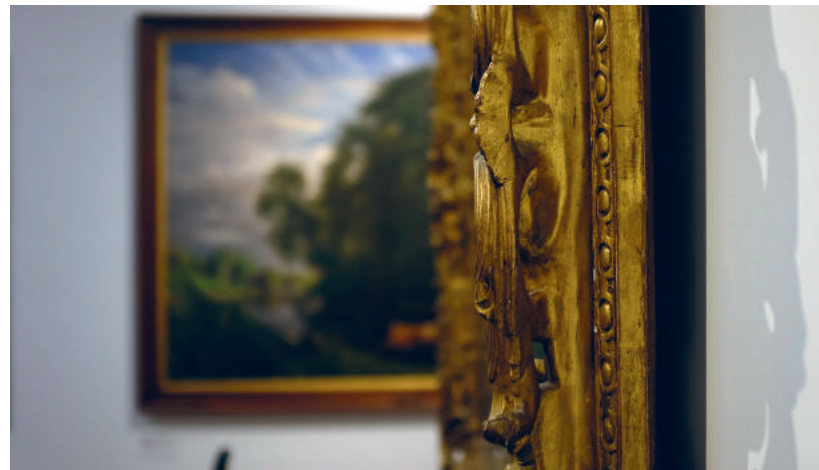
Hør om billedrammens betydning for et maleri