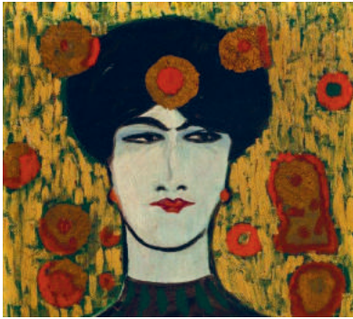
Storm P., Salome studie , 1908, Storm P. Museet (udsnit)

SØNDAG DEN 22. JANUAR KL 12 KUNSTHISTORIER