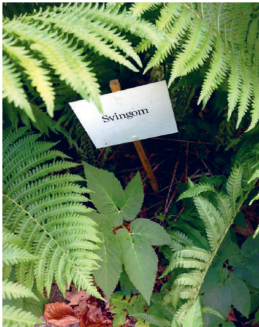
Ordvandringer i Reservat for truede ord

TIRSDAG DEN 6. SEPTEMBER KL 16 ORDVANDRING