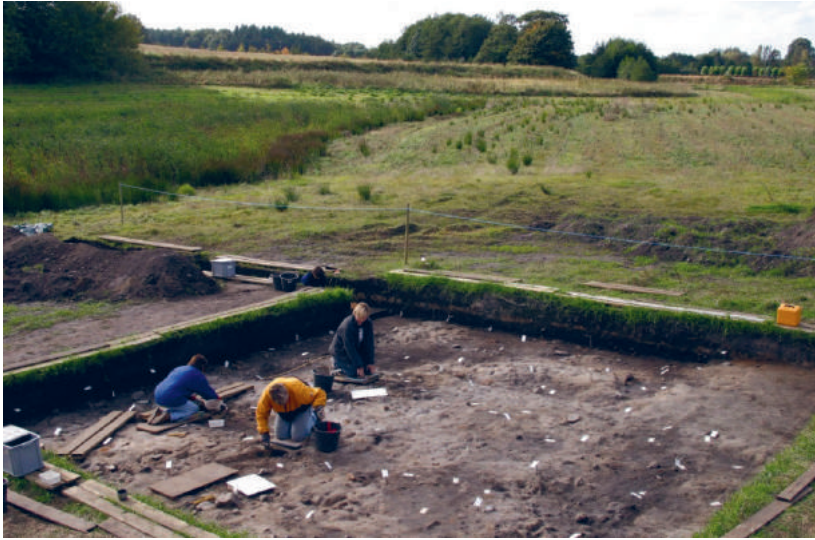
Stenalderboplads. I baggrunden ses stenalderfjordens kystskrænt