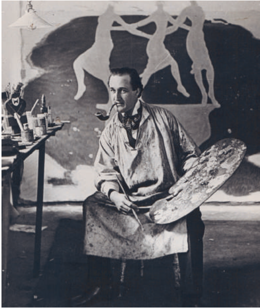
Storm P. fotograferet i sit atelier, ca. 1918 Ubekendt fotograf

Forside: Storm P., Pigen med cigaretten , 1909 Storm P. Museet