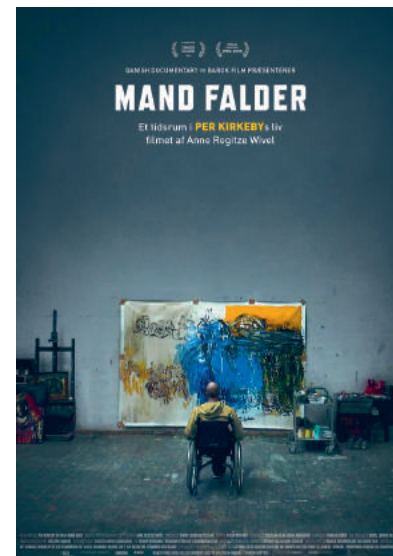
Filmfredag viser Mand Falder

åbner museet med sang Gratis for årskortholdere eller når entreen er betalt