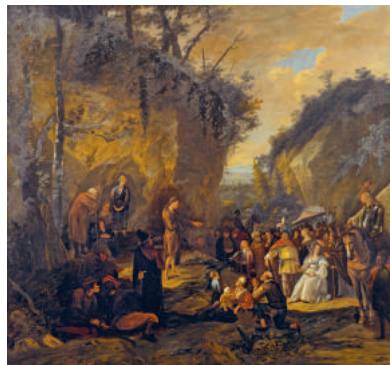
Jan Steen, Johannes Døberen prædiker , 1653 Nivaagaards Malerisamling