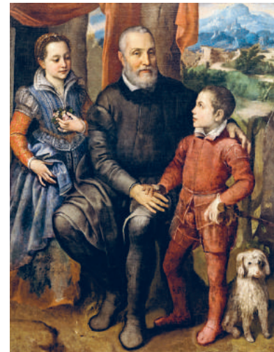
Sofonisba Anguissola, Portrætgruppe med kunstnerens fader Amilcare Anguissola og hendes søskende Minerva og Astrubale , ca. 1559 Nivaagaards Malerisamling