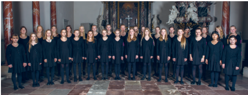
Fredensborg Slotskirkes Pigechor

KL 19.30 JULEKONCERT FREDENSBORG SLOTSKIRKES PIGEKOR Pris 150 kr. Halv pris for årskortholdere