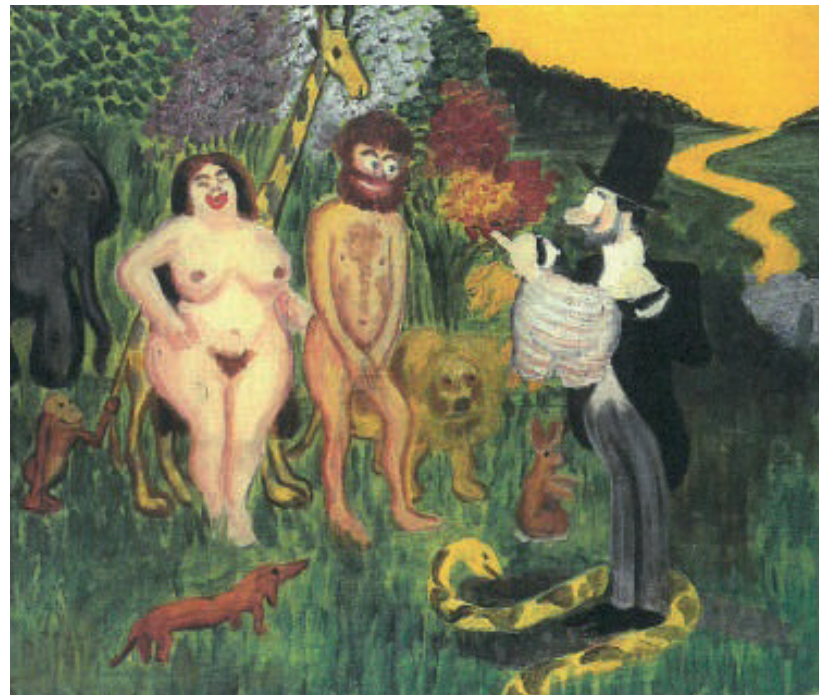
Storm P., Skrædderen i Paradis , 1906, Storm P. Museet

Omvisningerne er gratis for års- kortholdere eller når entreen er betalt