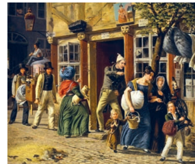
Wilhelm Marstrand, En flyttedagsscene , 1831