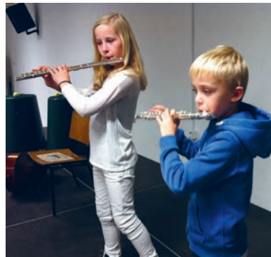
Elever fra Fredensborg Musikskole