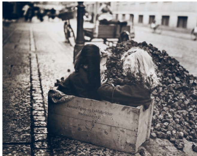
Bror Bernild, Kan vi være dette bekendt? , 1946

Gratis for årskortholdere eller når entreen er betalt