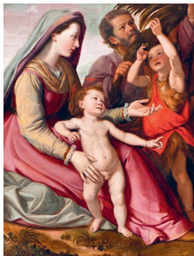
Santi di Tito, Den hellige familie og den lille Johannes Doberen , sidst i 1500 tallet

Gratuit pour les amis du musée ou une fois le billet d'entrée payé