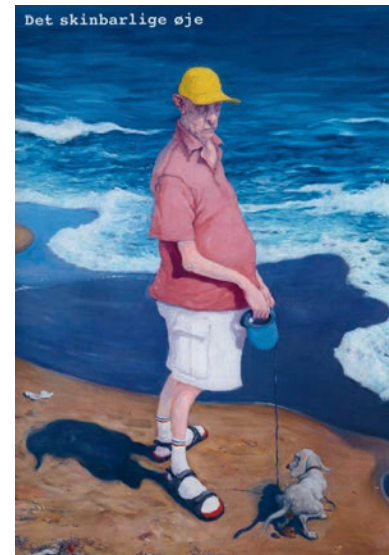
Det skinbarlige øje

Gratis for årskortholdere eller når entreen er betalt