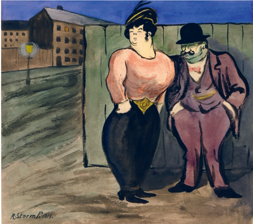
Storm P., En dame og en herre , 1914. Storm P. Museet