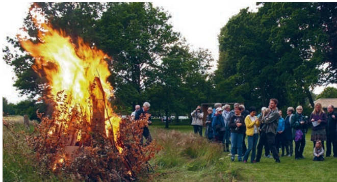
Skt. Hans på museet