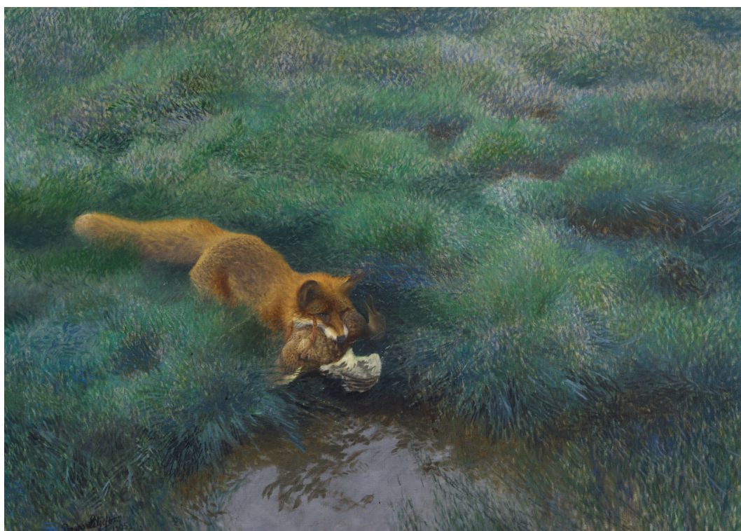
Serudstillingen med Bruno Liljefors åbner fredag d. 29. september. Bruno Liljefors, Ræv og and, 1905, Thielska Galleriet Stockholm

Få op til 50% rabat på arrangementer og fri adgang til museets udstillinger.