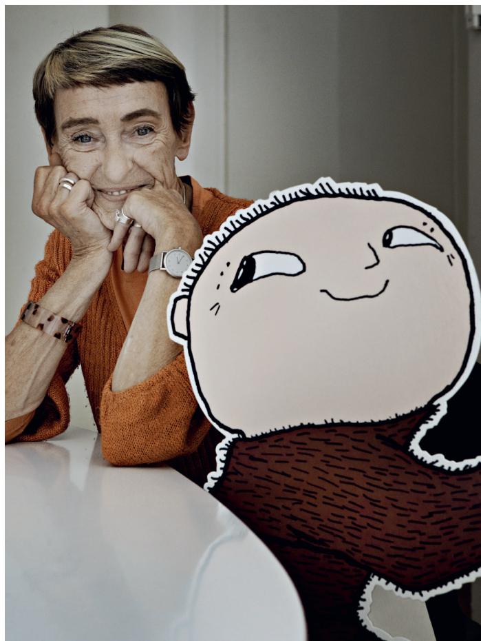
Kom til foredrag om Gunilla Bergström tirsdag den 12. september. Gunilla Bergström.