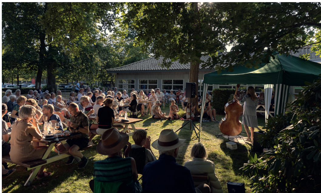
Glæd jer til sommerjazz på terrassen tre fredage i august.