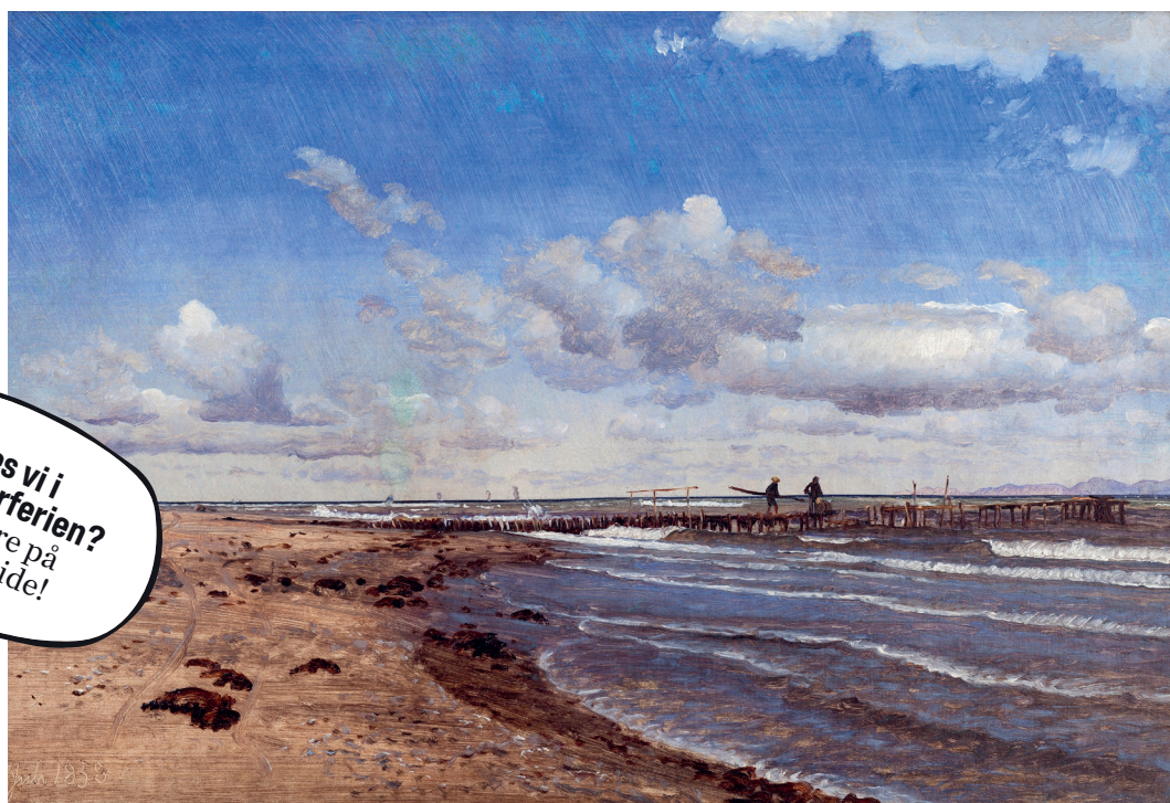
Dyk ned i samlingen. Der er introduktioner hver torsdag klokken 17. P. C. Skovgaard. Stranden ved Hellebæk, 1858.

Pris: 100 kr. / 70 kr. for årskortholdere.