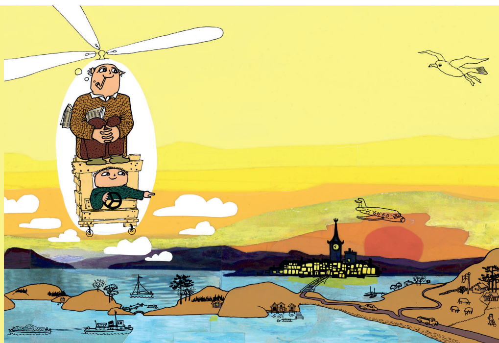
Gunilla Bergström, fra bogen Aja baja, Alfons Åberg, 1973. ©Bok-Makaren AB

I tilfælde af dårligt vejr eller tørke rykkes sang og taler inden døre på museet.