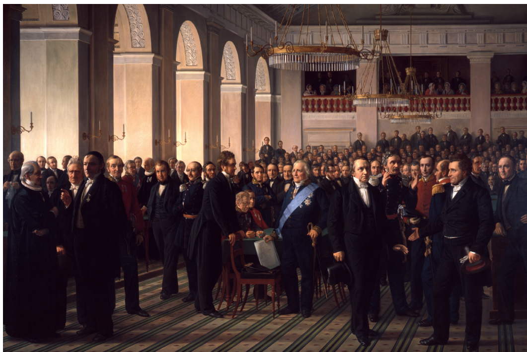
Kom til Grundlovsdagsfejring, når museet holder særåbent mandag d. 5. juni. Constantin Hansen, Den Grundlovgivende Forsamling, 1860-1864, Frederiksborg Slot.

Croquis på Nivaagaards Malerisamling er for alle, der vil prøve kræfter med at tegne efter model. Om du er garvet eller nybegynder, er du meget velkommen! Vores erfarne tegneunderviser giver vejledning og guider i teknikker undervejs.