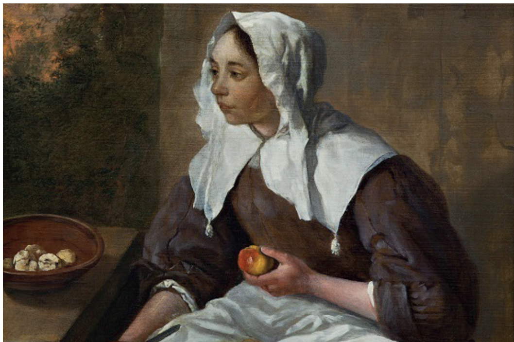
Bliv klogere på blandt andet Malerisamlingens værk 'En pige der skræller æbler' af Gabriel Metsu til foredrag, tirsdag den 7. november.