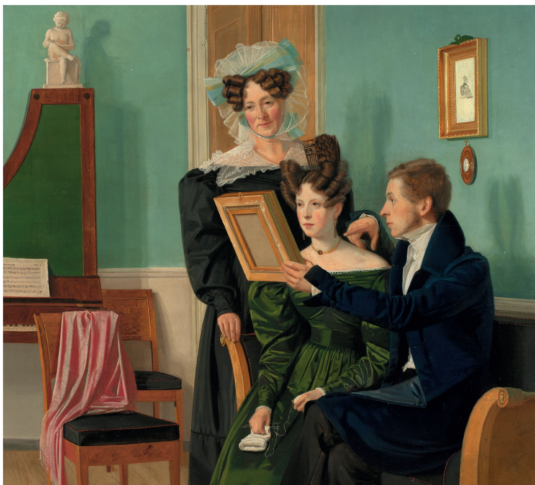
Hver torsdag kl. 17 er der introduktion til særudstillingen 'Da hverdagen stjal billedet i Holland og Danmark'. Wilhelm Bendz, Familien Raffenberg, 1830, Statens Museum for Kunst.