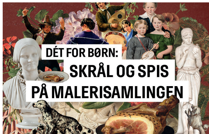
Kalder alle børn! Skrål og spis er i gang og børn spiser GRATIS.