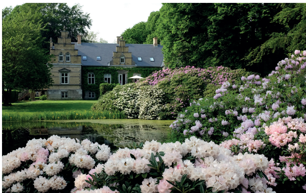
Det er den tid på året... Kom med på havevandring søndag den 26. maj kl. 13.