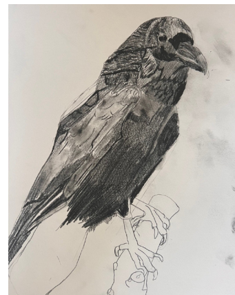
Tegning af elev fra Rembrandts Lærlinge

lide at være kreativ og tegne, så kan de blive en del af Rembrandts Lærlinge og lære en masse nye teknikker og metoder. Tilmelding sker efter først til mølle. Pris for 13 undervisnings-gange: 830 kr.